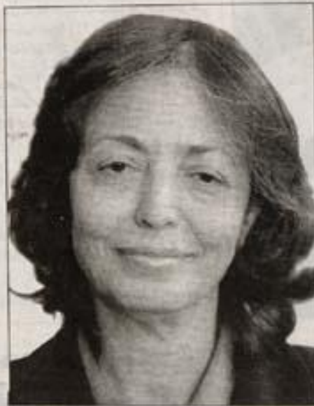
• السيدة ليليا العبيدي (وزيرة المرأة)