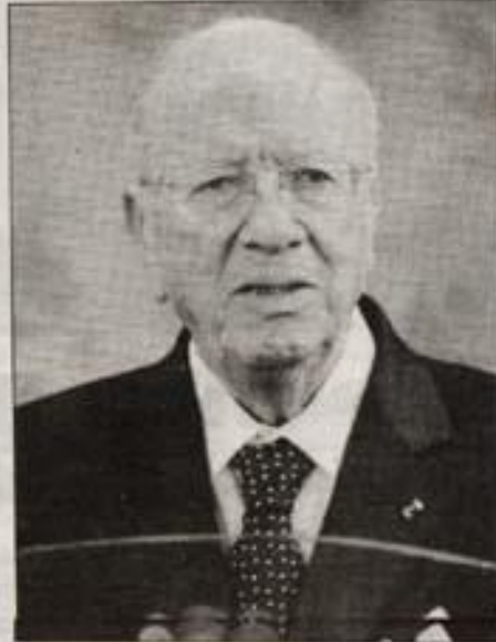
• السيد باجي قائد السبسي

ونتطلع إلى حكم يوجّه الانتخابات والساحة السياسية بصفة عامة ويفسر بأن الاعلام يقوم أحيانا بمثل هذه المحاولات ولكن نتائجها ليست علمية. وقال «في بلد كفرنسا يتم العمل على الأشخاص السياسيين لكن في تونس بما أنه لا وجود لوجود سياسية مؤثرة في الساحة ارتأينا البحث عن مقياس الثقة في أجواء الديمقراطية بصفة عامة».